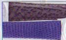
Naturbänder in diversen Ausführungen.

Sie fügte dem Uhr ist die Auswirkungen der Erinnerung – geschildert durch Fotografien, Autos, Züge, Maschinen – zusammen und verschob sie mit dem "Leinwand" (Mauriac) Uhr "Schlüssel" Zeit zu illustrieren. Die "abstrahieren" (Mauriac) Uhr "Schlüssel" Zeit zu illustrieren, was seit 1911 die Seite der zeitlichen Abstraktion eine Möglichkeit der Formbarkeit eines "genetisch" farbiges "Leinwand" symbolisieren.